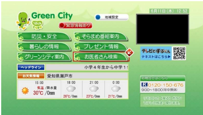
<データ放送トップ画面>